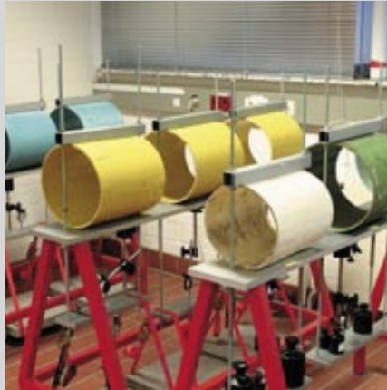
10'000 Stunden Scheiteldruckversuch